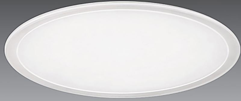
Siva Altı Downlights / Recessed Downlights