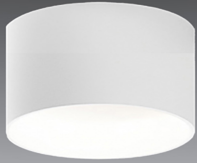
Sıva Üstü Downlights / Surface Mounted Downlights