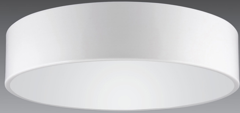
Sıva Üstü Downlights / Surface Mounted Downlights