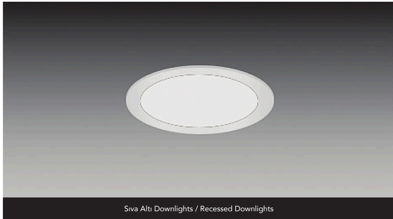
Siva Altı Downlights / Recessed Downlights