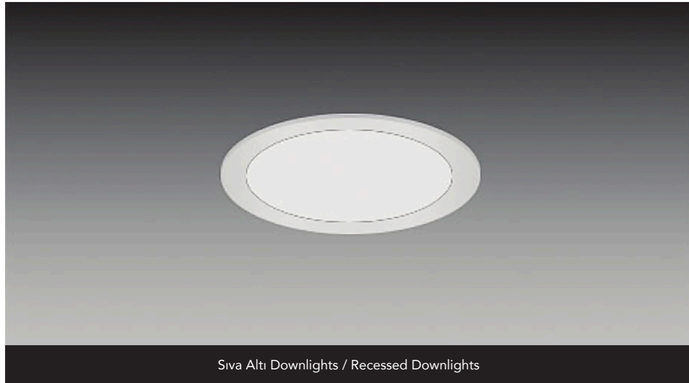
Siva Altı Downlights / Recessed Downlights